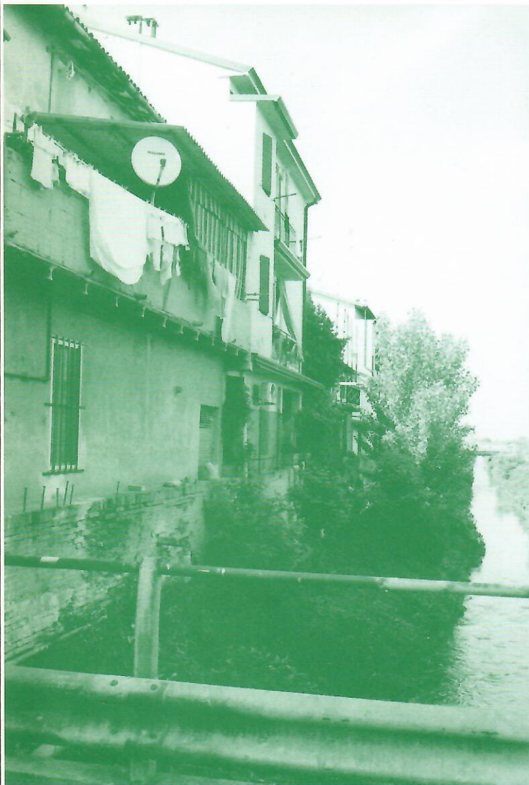
Ca' de' Fabbri un problema a cielo aperto. Un progetto da realizzare con i cittadini.