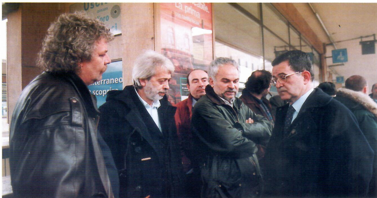
Giacomino e la delegazione FIOM-CGIL partono per Roma assieme a Romano Prodi, per discutere della vertenza Casaralta.

Alloggi popolari: in considerazione della fortissima richiesta di case a canone contenuto riteniamo indispensabile fruire della disponibilità manifestata dallo IACP e dalla Fondazione Cassa di Risparmio per la costruzione di alloggi popolari; riteniamo però altrettanto indispensabile aprire un confronto con la cittadinanza in merito all' area di collocazione.